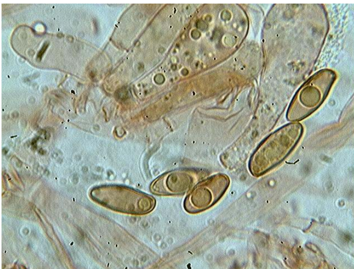
Spores x 1000 (dans le congo)