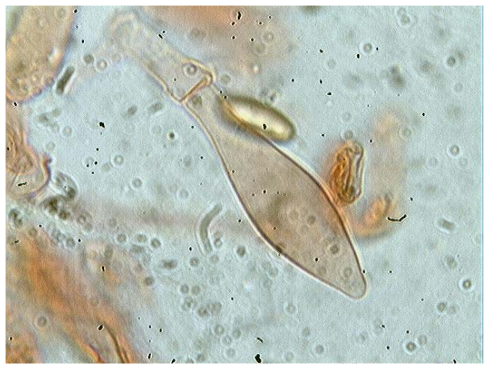
Cystide x 400 et x 1000 (dans le congo)