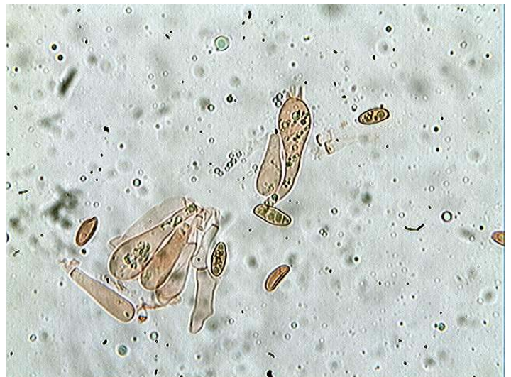
Basides et spores x 400 (dans le congo)