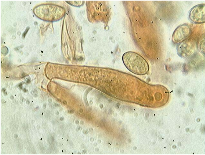
Cystide x 1000 (dans le congo)