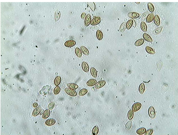
Spores x 400