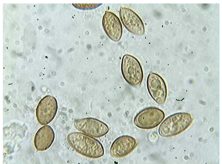
Spores x 1000