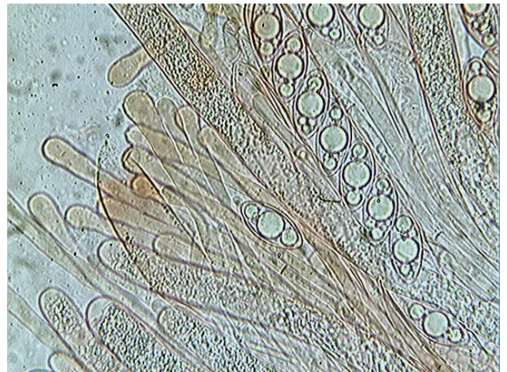
Paraphyses x 400 (dans le congo)