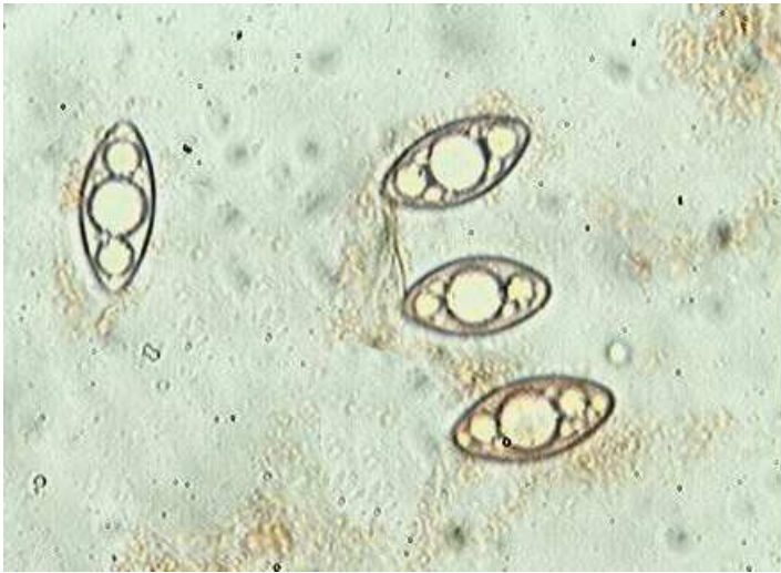
Spores x 100 (dans le congo)