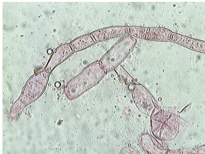
Hyphes de l'excipulum x 400 (dans la phloxine)