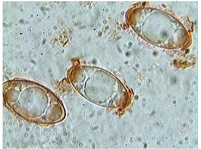
Spores x 1000 (dans le congo)