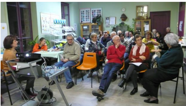
Une discussion a suivi la présentation

Elles ont pu apprendre, entre autres, ce qu'est le mycélium, les différentes parties du champignon, le cycle de vie des champignons, l'importance du biotope, les différentes familles de champignons, le tout illustré par de nombreux exemples. Cette séance a été suivie d'un moment de discussions.